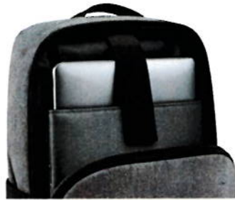
COMPARTIMENTO PARA LAPTOP 16" Separación acolchada que protege el equipo y facilita el acceso.