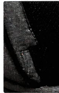
Costuras reforzadas y tirantes acolchados para mayor comodidad.