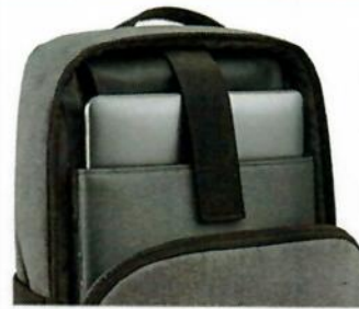
COMPARTIMENTO PARA LAPTOP 16" Separación acolchada que protege el equipo y facilita el acceso.