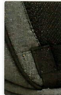
Costuras reforzadas y tirantes acolchados para mayor comodidad.